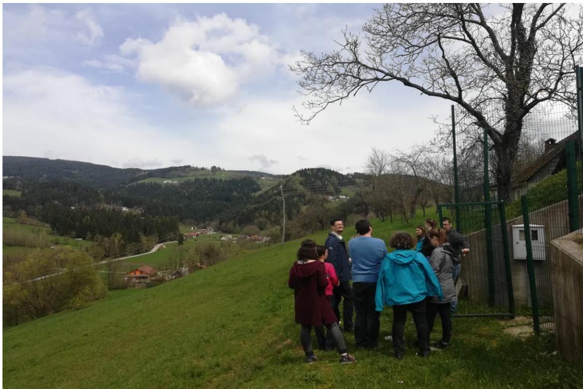
Slika 3: Študenti pri terenskem delu: popis vodnih virov na izbranih pilotnih območjih v občini Vitanje